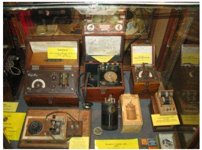
Petit espace, grand musée, au pays de l'invention du Radar