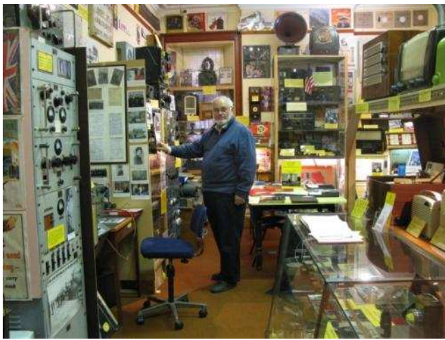
Un trésor à découvrir pour tous les amateurs de la belle chose : La Radio